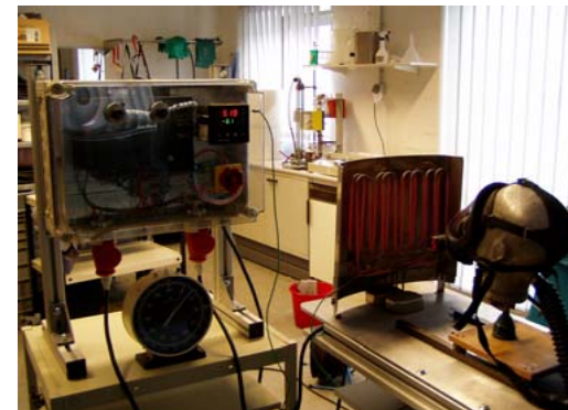
Bild 3: Prüfung eines Lungenautomaten auf Beständigkeit gegen Wärmestrahlung