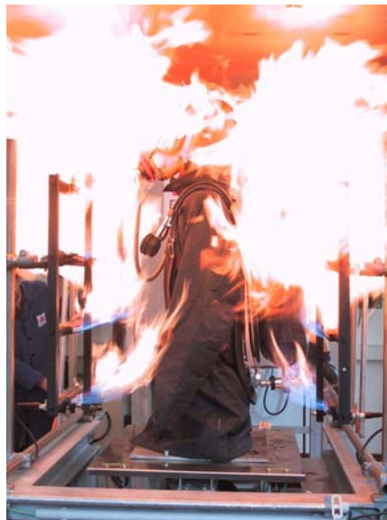
Bild 6: Prüfung der Beflammung nach DIN EN 137:2007

Auch hier wird eine eventuelle Wiederverwendbarkeit der so geprüften Atemschutzausrüstung nicht geprüft.