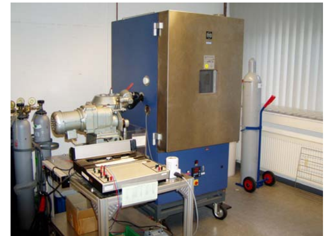
Bild 1: Prüfung auf Temperaturbeständigkeit in einem Temperaturschrank

Die so geprüften Pressluftatmer müssen nach diesen Prüfungen weiterhin dicht und funktionsfähig sein.