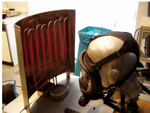
Bild 2: Prüfung einer Vollmaske auf Beständigkeit gegen Wärmestrahlung

Eine eventuelle Wiederverwendbarkeit der so geprüften Atemschutzgeräte wird nicht geprüft.